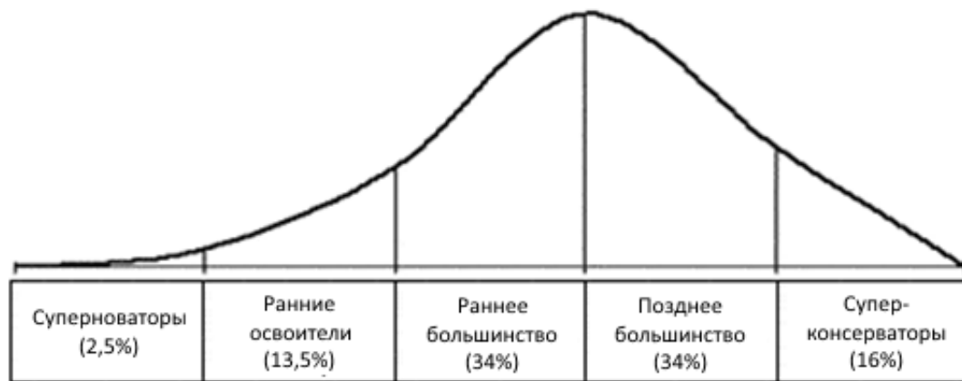
Рисунок 1.1 – Ранжирование покупателей

Ранжирование покупателей описывается кривой нормального распределения (рисунок 1.1).