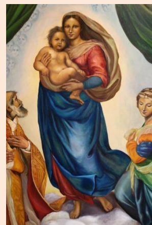
Рафаель «Сікстинська Мадонна» (1513–1515)

Знайди в мережі Інтернет цікаві факти про полотно Рафаеля «Сікстинська Мадонна».