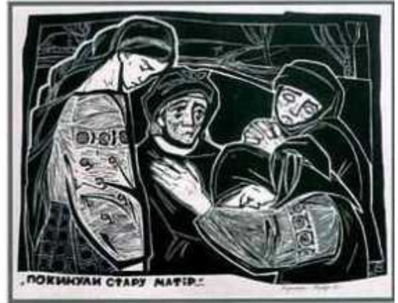
С. Караффа-Корбут. Ілюстрація до вірша «Ой три шляхи широкії...». 1963 р.