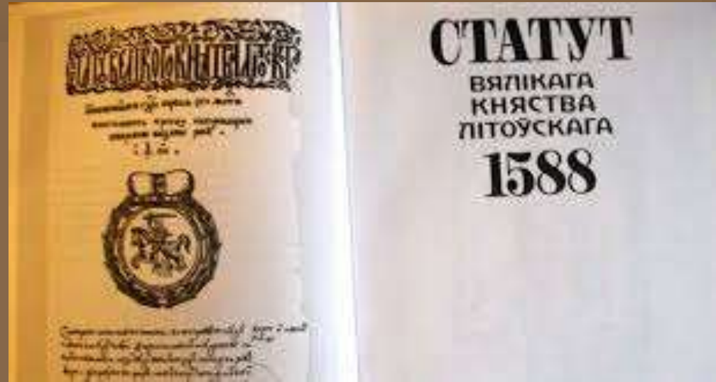
Литовські статуты 1529, 1566, 1588 рр.

У період існування Великого князівства Литовського на українських землях діяли правові норми Литовських статутів.