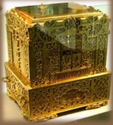
Золотий ковчег для зберігання «Руської правди»

Якщо уб'ють княжого мужа під час розбою, а вбивцю не шукають, то платити верву 80 гривень тій верві (сільській громаді), в якій голова убитого лежить, а коли простолюдин, то 40 гривень. [...]